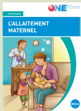
Alimentation (0 - 18 mois et +) L'ALLAITEMENT MATERNEL

>> Ces publications sont disponibles sur le site web de l'ONE <<