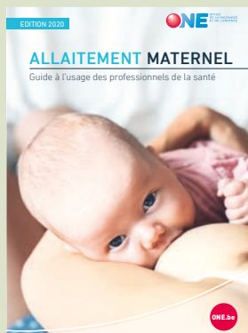
ALLAITEMENT MATERNEL Guide à l'Usage des professionnels de la santé