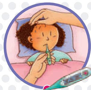
Fiebre moderada (38°)