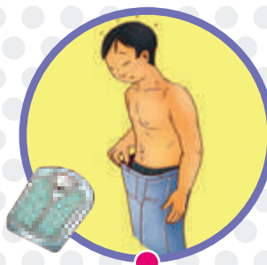
Pérdida de peso o, en el caso de los niños, peso que no aumenta

ENTRE LOS NIÑOS, LA ENFERMEDAD SE PUEDE DESARROLLAR RÁPIDAMENTE, CON POCOS O MUCHOS SÍNTOMAS.