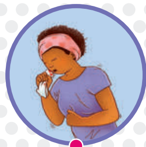
Expulsión de moco al toser, a veces con sangre