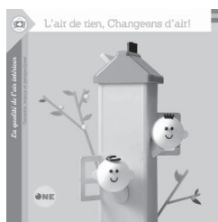
Illustrateur: Olivier GOKA

Le coffret se compose de différents outils, qui abordent la question de l'environnement intérieur de manière pragmatique et variée sous différents supports papiers. Les liens entre les outils permettent d'entrer petit à petit dans la matière en fonction du rythme et des besoins de chacun.