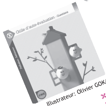
Illustrateur: Olivier GOKA