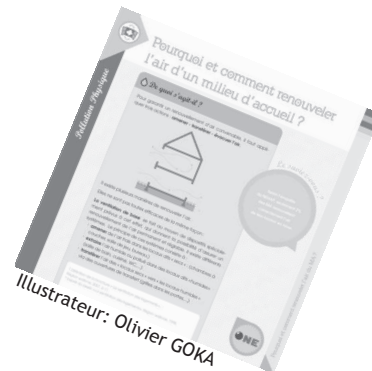
Illustrateur: Olivier GOKA

Si vous n'avez pas eu l'occasion d'assister à l'une des journées de présentation en subrégion, vous pourrez vous procurer le coffret et ainsi découvrir son entièreté en prenant contact avec votre coordinatrice accueil ou votre agent conseil. Des ateliers sont également prévus en subrégions pour les accueillantes autonomes.