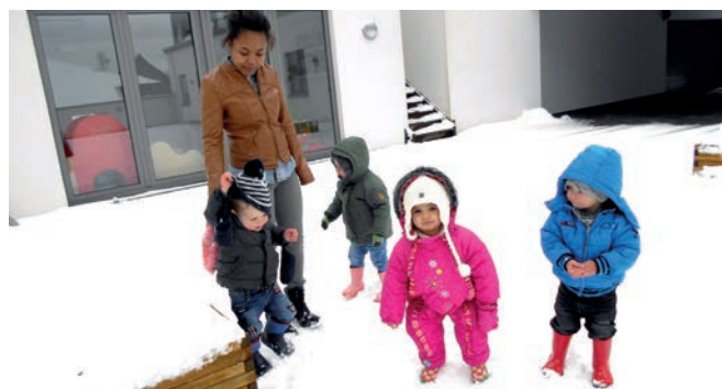
Halte Accueil «La pause Grenadine» à Bastogne

« Il n'y a pas de mauvais temps, il n'y a que des mauvais vêtements 2 ! »