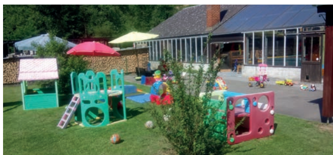
AEC Mme Fondeur à Bomal-sur-Ourthe

C'est pourquoi les lieux d'accueil sont invités à réfléchir à la présence d'arbres, de parasols, de tentes solaires, de préaux... qui permettront lorsqu'il fait ensoleillé de se protéger des rayons du soleil et quand il pleut, de ne pas se sentir trempés (même si des vêtements pratiques permettent d'investir l'espace extérieur par temps plus maussade...).