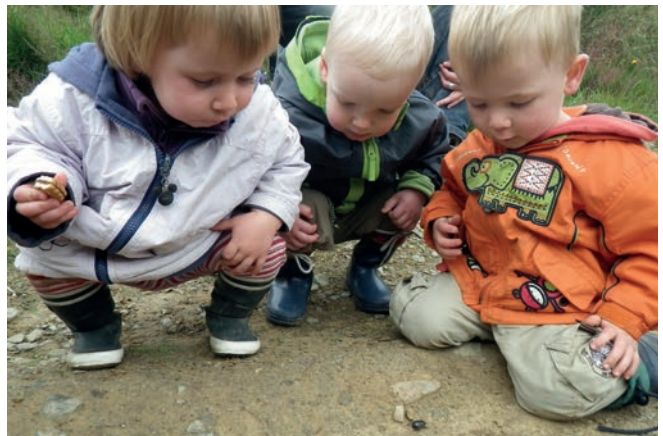
Vitamine Verte) - Good Planet Belgium