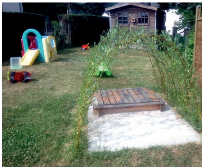
Maison d'enfants « L'Arche de Noé » à Grummelange