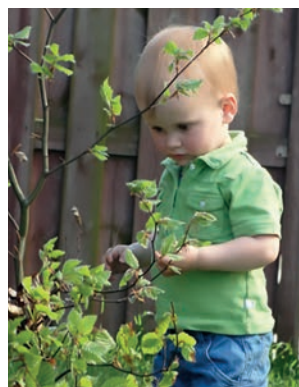
Vitamine Verte) - Good Planet Belgium

Il est prouvé que sortir stimule la motricité et favorise chez l'enfant l'exercice de la « grosse » motricité (courir, sauter, grimper, rouler à vélo...).