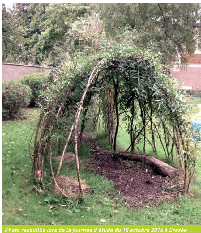
Photo recueillie lors de la journée d'étude du 18 octobre 2016 à Erezée

Par exemple, l'enfant peut trouver refuge dans une cabane de saule bien touffue ou derrière une maisonnette, pour autant que l'adulte ait assuré la sécurité et limite les sources de risques. Ces espaces d'intimité, espace refuge, offrent une possibilité à l'enfant de se mettre en retrait du groupe pour intégrer les événements vécus. Ils permettent aussi aux enfants plus grands de vivre leur autonomie.