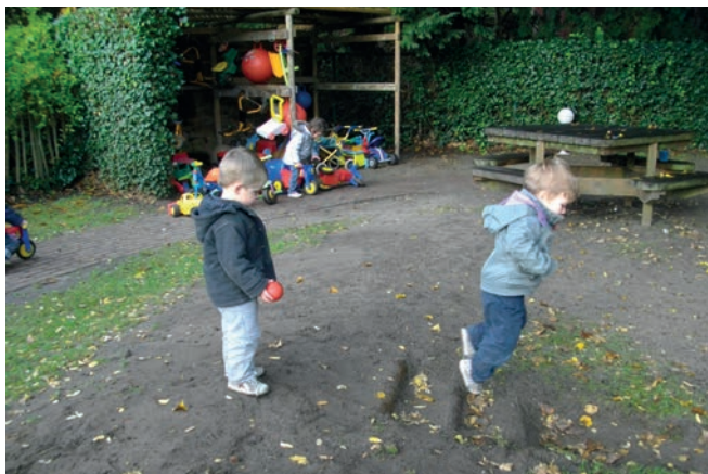
Vitamine Verte) - Good Planet Belgium

Par exemple, un terrain « escarpé » peut devenir un espace pour des jeux moteurs, moyennant un accès et une sécurisation adéquats.