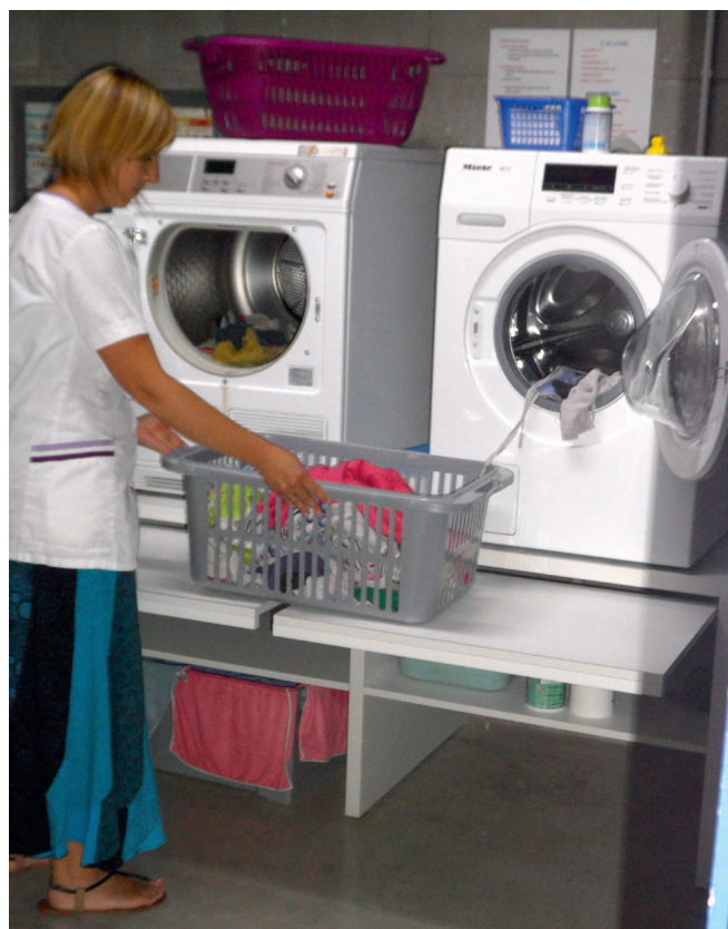
Crèche L'Arche Dadoux

Une tablette coulissante sous chaque appareil permet de poser la manne pour sortir le linge et la faire glisser sur la tablette face au sèche-linge. » relate Sindy REDING, puéricultrice