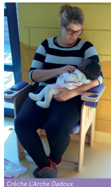
Crèche L'Arche Dadoux