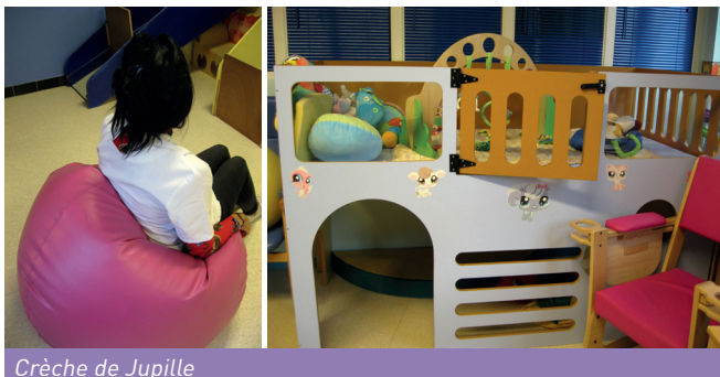
Crèche de Jupille

Mais encore... les responsables des milieux d'accueil ont proposé qu'une partie des moyens financiers soit allouée à l'achat de nouveaux équipements, tels que :