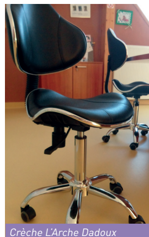
Crèche L'Arche Dadoux