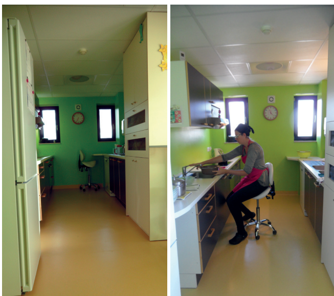
Crèche L'Arche Dadoux

« Les problèmes de dos se sont aggravés l'année passée. Avec le conseiller en prévention, nous avons revu toute l'organisation de la cuisine pour soulager au maximum le port des charges et trouver une assise confortable pour les tâches quotidiennes. La disposition du mobilier a été revue et les meubles les plus utilisés sont en hauteur. Un meuble avec deux tiroirs (et moustiquaires) pour ranger les fruits et autres rangements a été réalisé. L'achat d'un nouveau frigo-congélateur avec une préférence pour le frigo (plus utilisé) dans la partie supérieure et le congélateur dans la partie inférieure.