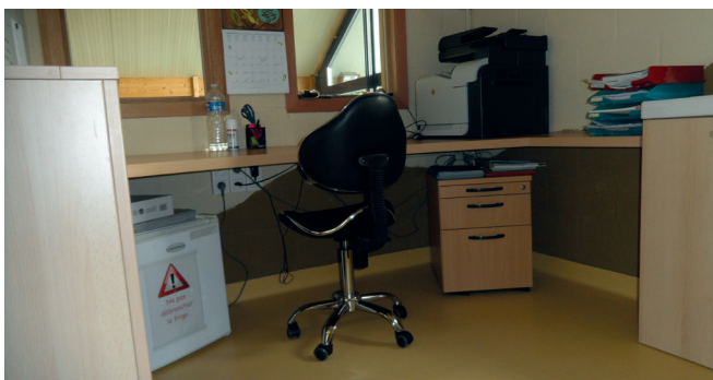
Crèche L'Arche Dadoux

Un espace réservé, avec lumière naturelle et mobilier adapté.