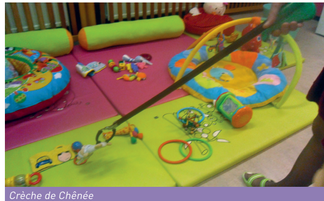
Crèche de Chênée