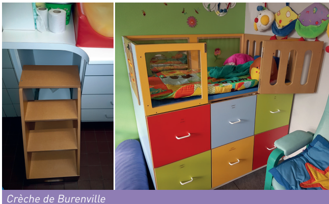
Crèche de Burenville

Cette formation a été accueillie avec grand succès par chacune des équipes et ce qui semble avoir davantage « marché », c'est l'observation réalisée auprès de chacune des accueillantes dans leurs pratiques et dans leurs gestes quotidiens. Pour chaque membre du personnel, des remarques ont été formulées et des solutions ont été apportées (au départ du matériel présent) ou proposées pour améliorer certaines postures.