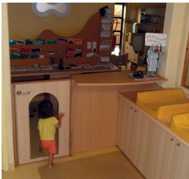
Crèche L'Arche Dadoux