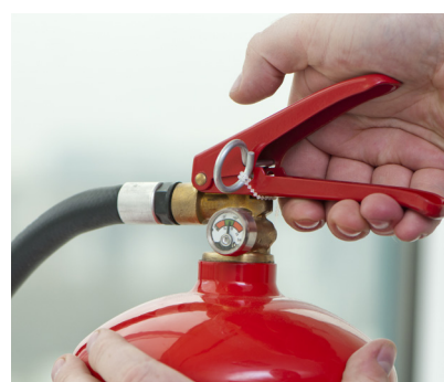
MCAE Les Loupiots Beyne-Heusay Province de Liège

Un exercice du même type devrait être à nouveau réalisé avec nos « vrais » enfants... Mais là, il faut réfléchir à comment le faire, dans les meilleures conditions possibles, sans effrayer les enfants.