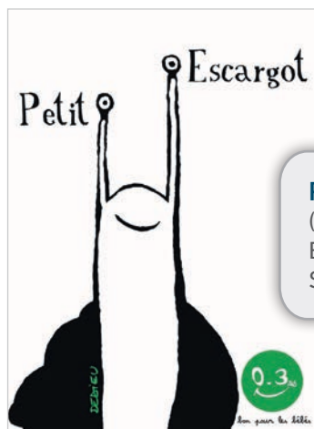
PETIT ESCARGOT (Thierry DEDIEU, Bon pour les Bébés, Seuil)

Et du bonheur, il y en a dans ces deux albums présentés. Du bonheur parce qu'ils sont tous les deux dans un vrai partage de lecture et de jeu entre l'adulte et l'enfant :