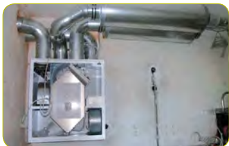
«Système de ventilation double flux»

Des systèmes plus sophistiqués régulent en continu la circulation de l'air dans tout le logement. Ces systèmes sont programmés pour les habitants en fonction de leurs activités quotidiennes.