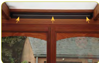
«Grille de ventilation réglable dans un châssis»

Observer notre logement permet de repérer les systèmes de ventilation (différentes grilles d'aération, « petits trous » dans le montant inférieur des châssis anciens, extracteurs mécaniques, ventilation double flux...).