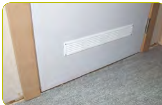
«grilles d'aération dans les châssis et/ou portes»

Les systèmes de ventilation mécanique sont réglables de façon à modifier les débits d'arrivée et de sortie d'air (ex : ouverture-fermeture d'une grille, augmentation-diminution de la vitesse de l'extracteur mécanique).