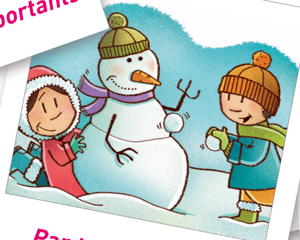
Par tous les temps