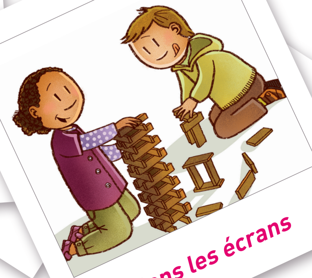
Sans les écrans