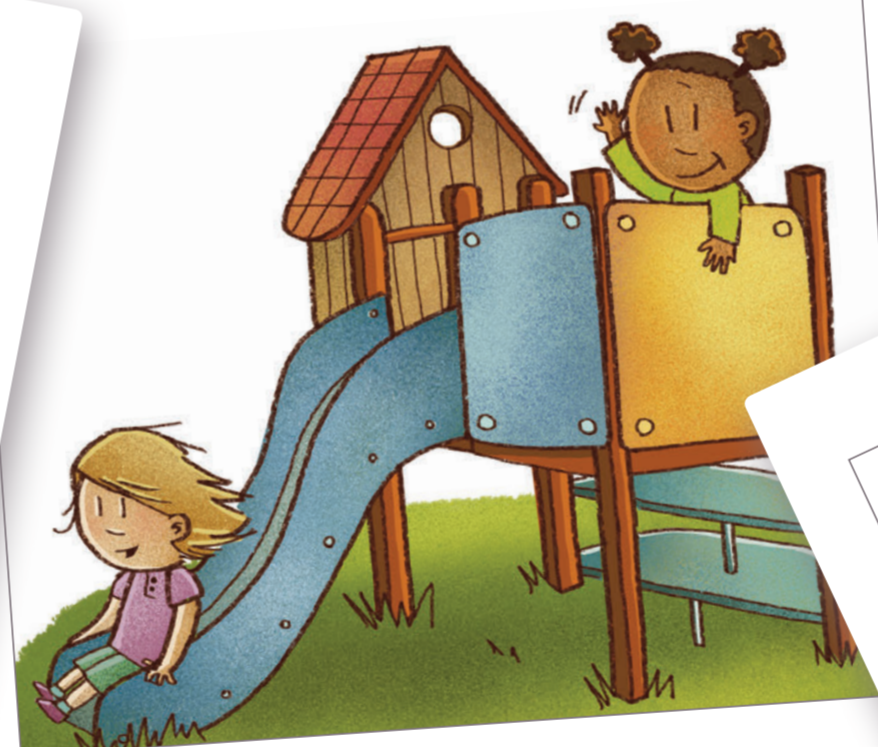
C'est si amusant